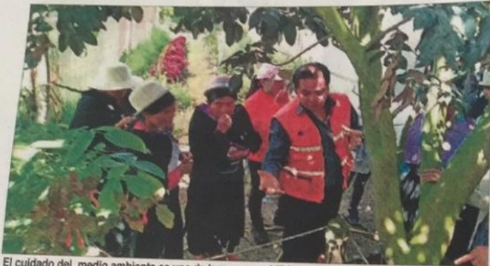
El cuidado del medio ambiente es una de las responsabilidades del Gobierno Provincial.

Las personas de 18 años interesadas en el cuidado de los recursos ambientales están invitadas a participar en el proceso de formación "Liderazgo Ambiental con Enfoque de Género". El Centro de Formación Ciudadana de Tungurahua (CFCT) de la Dirección de Planificación conjuntamente con la Fundación ACRA, la Unidad de Movimientos Indígenas y Campesinas convocan a fomentar la corresponsabilidad entre los actores urbanos y rurales.